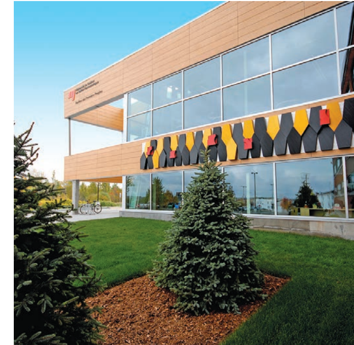
Pavillon des Premiers Peuples

Diplômes décernés à des étudiants autochtones par les établissements du réseau de l'Université du Québec par domaine d'étude