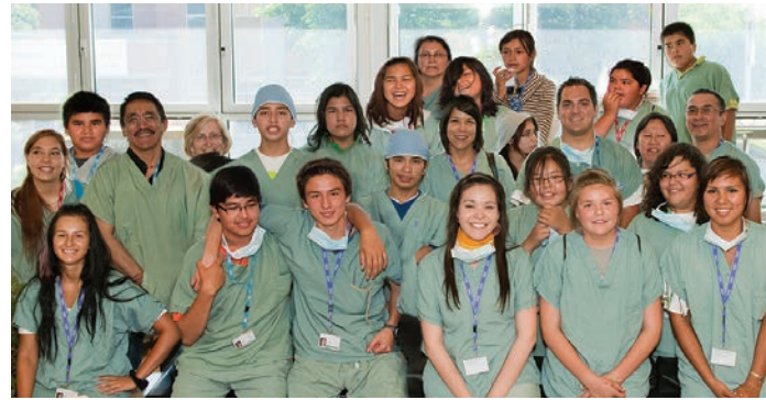
Étudiants du Camp santé jeunesse autochtone