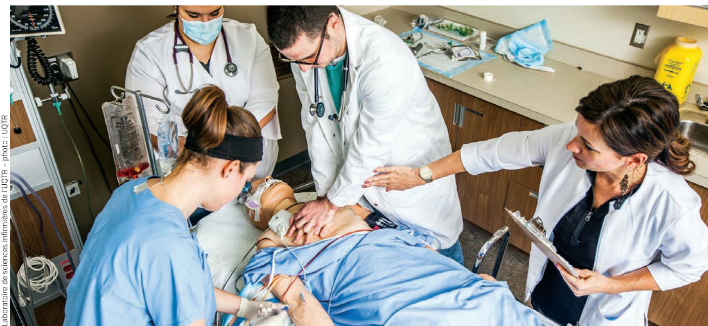
Laboratoire de sciences infirmières de l'UQTR

Près de 17% des recherches financées dans le réseau et 29% des publications scientifiques produites par les professeurs-chercheurs du réseau sont en lien avec les thématiques de la santé humaine et sociale.